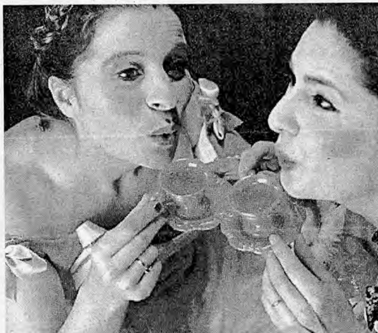
Spectacle. Manga et lyrisme pour les enfants