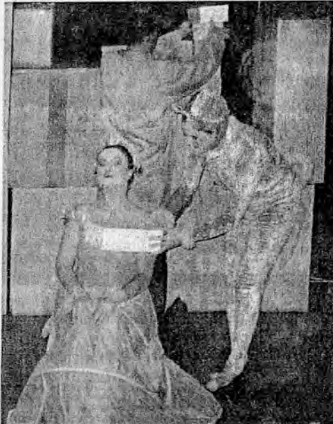
La Compagnie Opéra Light innove en jouant une pièce de théâtre de manière lyrique

Et ce sont surtout des acteurs qui ont conquis le jeune public.